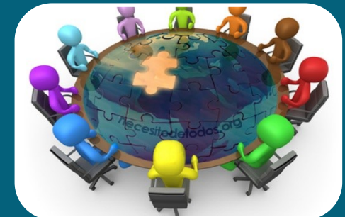
Relación órganos de gobierno de la empresa