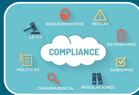
Cumplimiento normativo o Compliance