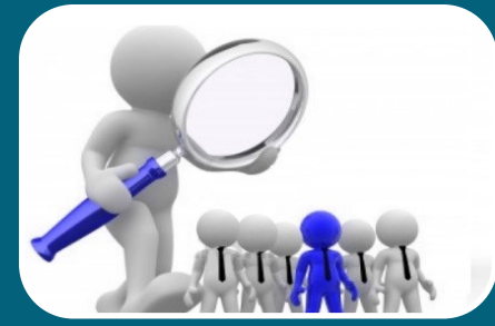
Mecanismos de Control